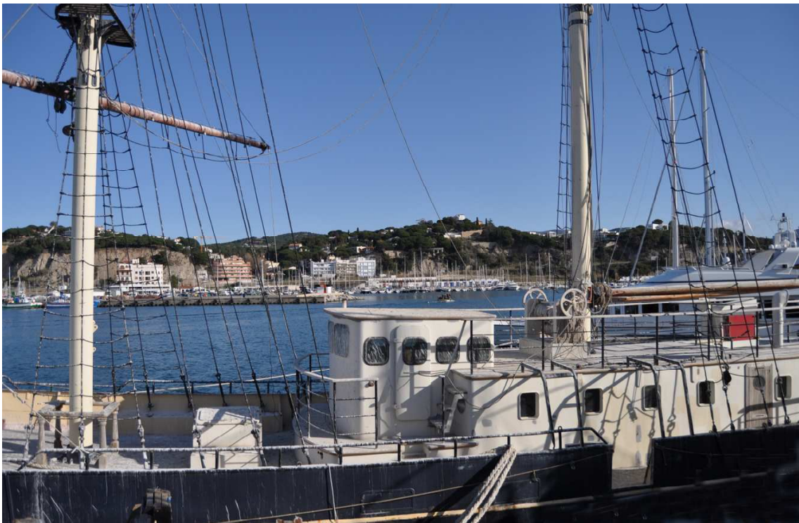
Vista del bergantí Sirius al més de maig, amarrat a Varador 2000

Així, d'aquesta manera, Arenys de Mar i Tuscania, entraran en una sinèrgia nàutico-artística a bord del Sirius, un vaixell que s'anomena així per l'estrella que inspira el perfum evocatiu del mar.