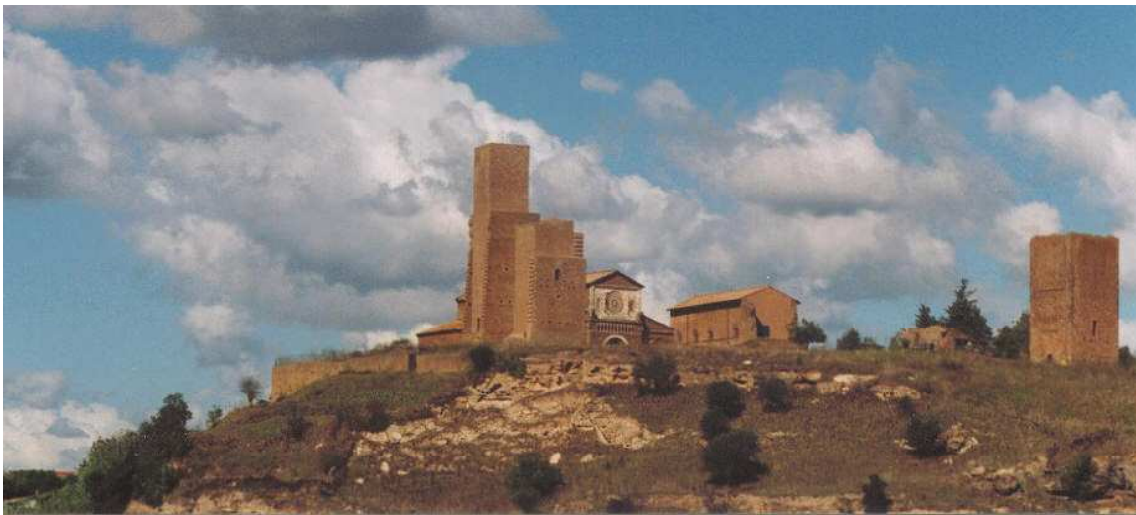
Vista panoràmica de Tuscània

Guido Borghi mostra així la seva generositat fent l'esforç d'integrar la seva obra en el tarannà mariner del poble que l'acull; i la vila el correspon amb una visita institucional, el dia de la inauguració, el 9 de juliol a les 20'30 hores, en el marc de la Festa Major.