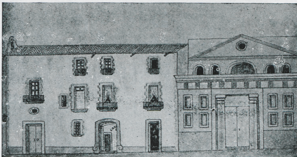
Local del carrer de l'Església on funcionà l'escola nàutica restaurada des de 1869 a 1874.

Després de la revolució de setembre de 1868, la Junta Revolucionària d'Arenys de Mar, el 16 d'octubre d'aquell any acordà restablir l'escola de nàutica, fent-se'n càrrec l'Ajuntament que vingué després, el qual la legalitzà com a centre agregat a la Universitat de Barcelona.