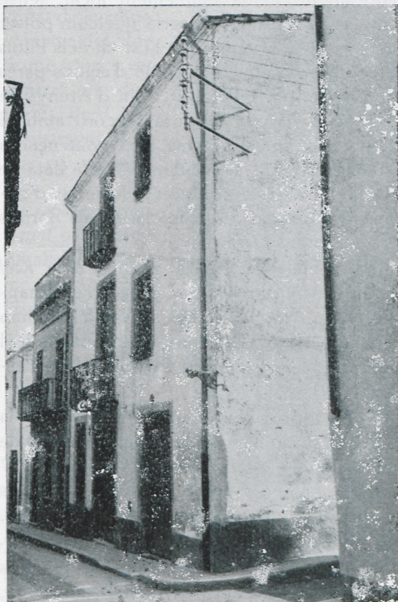
Casa núm. 37 del carrer de l'Església on començà l'estudi dels Pilots l'any 1779.

els beneficis de la justa bona voluntat del quart Borbó. Les indústries arenyenques gaudiren d'un més gran desenvolupament i se'n feren de noves, car s'exportaren al Nou Món les randes, mitges de seda i cotó, vels, indians, galons i cotonines. Al cloure's el segle XVIII, la vila augmentà els seus habitants en un 35 per cent i en poc temps es