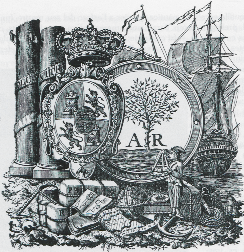
Escut de l'Escola de Nàutica d'Arenys de Mar utilitzat des de l'any 1795.

cia del centre i la perfecció de l'ensenyament, el rei li donà permís per tenir hissada la bandera espanyola de guerra i li atorgava el títol de Real Escuela Náutica de Arenys de Mar . La mort del mestre Baralt, esdevinguda l'any 1829, no va interrompre la vida de l'Estudi dels Pilots i es pogué evitar, amb l'esforç de tots, que fos suprimit a benefici d'una altra escola que tot just feia la viu-viu a la banda del Maresme; es féu càrrec de la direcció de la nostra escola un altre famós navegant, Francesc de P. Farrucha, enviat des de Cartagena. L'Estudi dels Pilots d'Arenys de Mar persistí fins l'any 1850, quan per reial ordre les escoles de nàutica foren agregades als instituts de segon ensenyament i tretes de la jurisdicció de Marina.