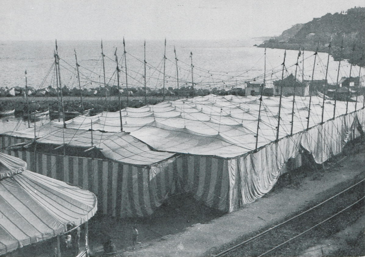
L'envelat al Port, durant l'última etapa de la seva construcció.