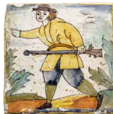
Rajola d'arts i oficis. Museu d'Arenys de Mar. Núm. registre 10917