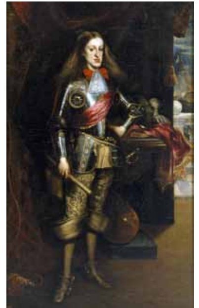
Carles II d'Àustria

Arenys de Mar, vila marinera que havia anat creixent des de la seva separació d'Arenys de Munt, viurà intensament aquest conflicte, sobretot els darrers anys, quan Catalunya haurà de lluitar sola davant l'exèrcit franco-espanyol.