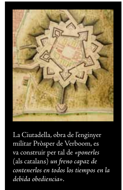
La Ciutadella, obra de l'enginyer militar Prósper de Verboom, es va construir per tal de «ponerles (als catalans) un freno capaz de contenerlos en todos los tiempos en la debida obediencia».