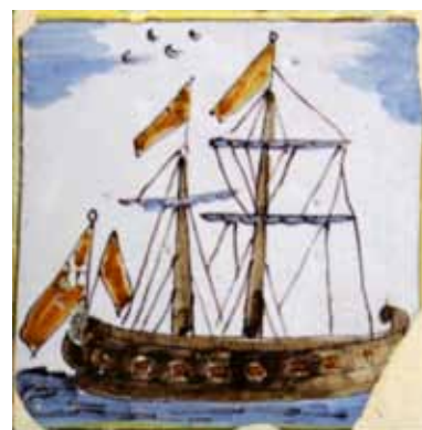
Rajola d'arts i oficis. Museu d'Arenys de Mar. Núm. registre 9964

Tot i la retirada, uns dies més tard, les forces de Felip V tornen a atacar la zona costanera i es proposen recuperar Sant Pol, poble on hi arriben dues galeres borbòniques carregades de soldats i pertrets de guerra. A més de per mar, els soldats filipistes també pugen per Sant Iscle "a on saquejaren la major part de les cases (...) i hi cremaren