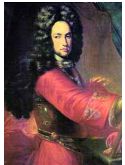
L'arxiduc Carles d'Àustria