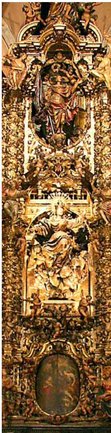
Fragment del retaule de Santa Maria d'Arenys de Mar.

Ben aviat, quan Barcelona encara era en mans de Felip V i un estol aliat inicia el setge per recuperar la ciutat, Arenys ja es posiciona pel candidat austriacista i sabem que el 28 d'agost de 1705, els jurats de la vila van a Barcelona a retre obediència a l'arxiduc Carles 1 . Aquest setge acaba amb la victòria dels austriacistes i a partir d'aquesta data Barcelona serà fidel a l'arxiduc fins al final de la guerra. Aquesta victòria es va celebrar a Arenys amb focs artificials 2 .