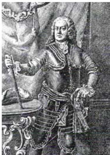
El general Antoni de Villarroel