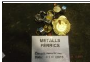
12. Metall fèrric