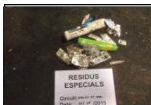
16. Residus especials