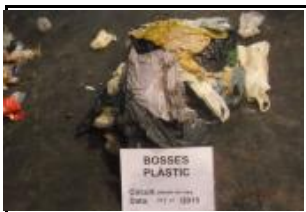
11. Bosses de plàstic