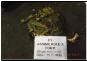
4.2 Fracció vegetal assimilable a FORM