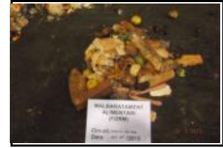
4.1 Malbaratament alimentari FORM