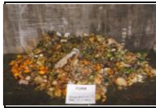
4.3 FORM no inclosa als grups 4.1 i 4.2