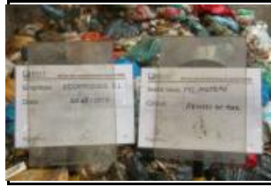
2. Identificació del Lot