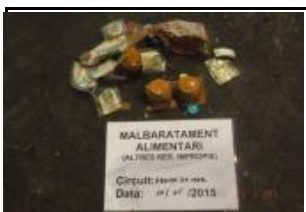
19.1 Malbaratament alimentari Altres