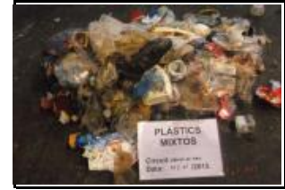
10. Plàstic, mixtos i film