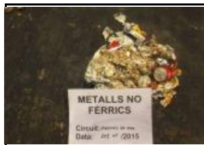
13. Metall no fèrric