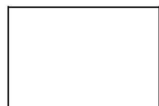
18. Residus voluminosos (trobad a la mostra)