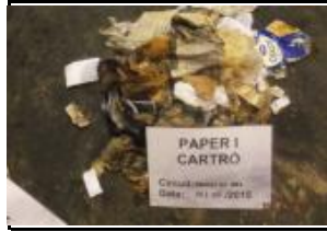
9. Paper i cartró