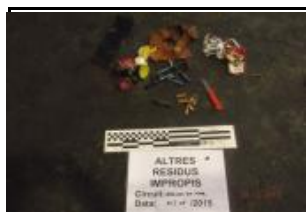
19.2 Altres no inclosos en grup 19.1