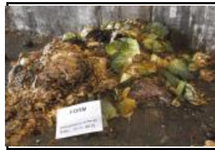
4.3 FORM no inclosa als grups 4.1 i 4.2