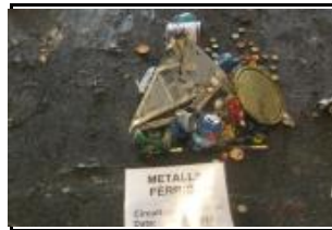
12. Metall fèrric