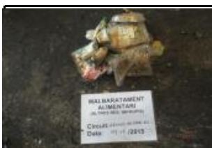
19.1 Malbaratament alimentari Altres