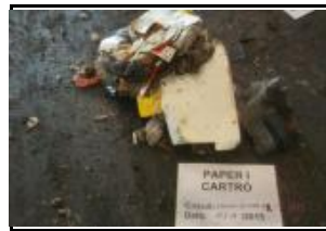
9. Paper i cartró