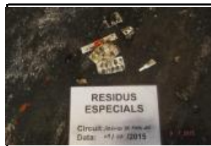
16. Residus especials