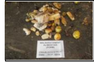
4.1 Malbaratament alimentari FORM