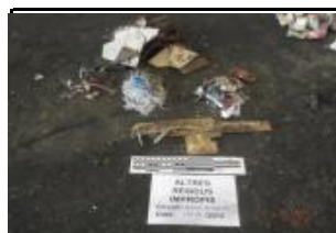
19.2 Altres no inclosos en grup 19.1