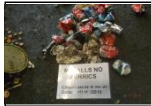
13. Metall no fèrric