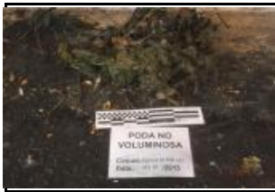
7. Poda no voluminosa (trobad a la mostra)