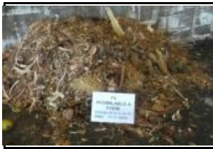
4.2 Fracció vegetal assimilable a FORM