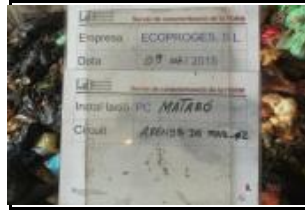
2. Identificació del Lot