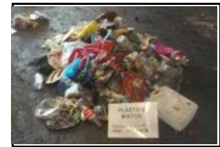
10. Plàstic, mixtos i film