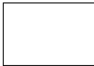
5. Poda voluminosa (trobad a al lot)