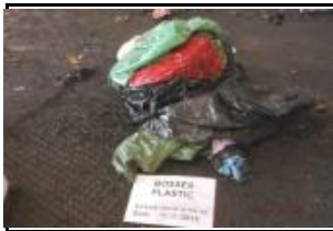
11. Bosses de plàstic