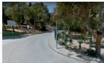
▲ Baixada de Lourdes

També en els primers mesos del 2018 està previst l'arranjament dels carrers Montalt, Montserrat, Sa Clavella, Mirador del Maltemps, Avinguda Europa, Doedes i el tram alçat de Sa Clavella. D'altra banda, en les pròximes setmanes es reprendran les obres dels locals a les feixes del Xifré. Les obres ja estaven adjudicades i iniciades, però el projecte s'ha hagut de refer després de comprovar-se que tenia importants deficiències que calia solucionar abans de continuar els treballs. •