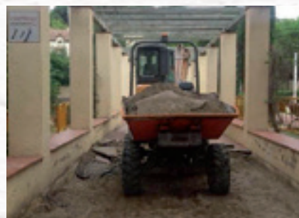
▲ Parc de l'Asil Torrent