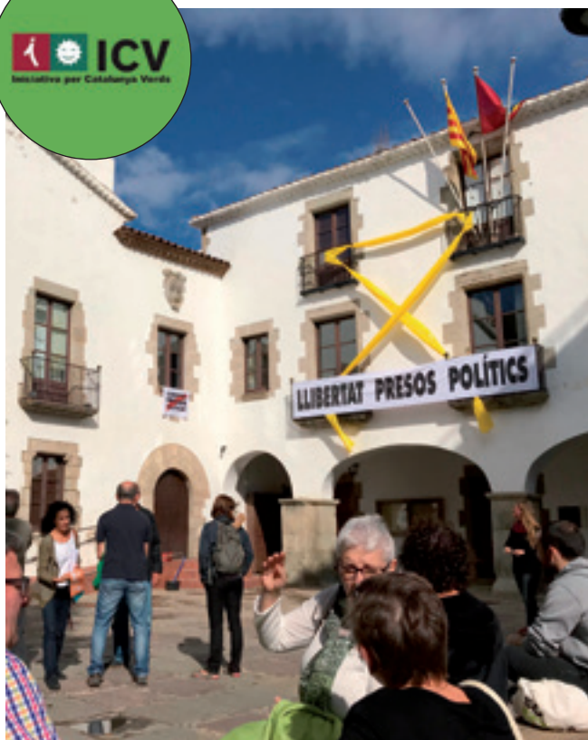
#arenysdemar #LlibertatPresosPolitics #helpCatalonia #saveEurope #democracy #freedom