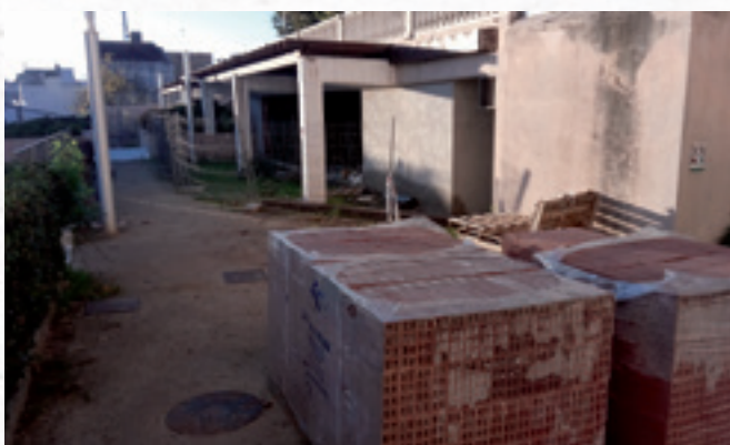
▲ Feixes del Xifré