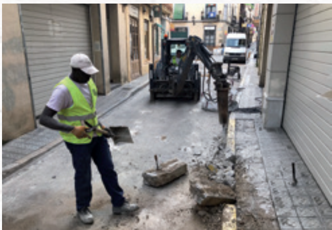
▲ Carrer de la Perera