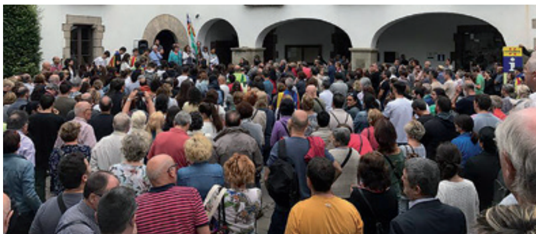
▲ Arenys de Mar ha mostrat una conducta impecable en totes les concentracions celebrades les darreres setmanes.