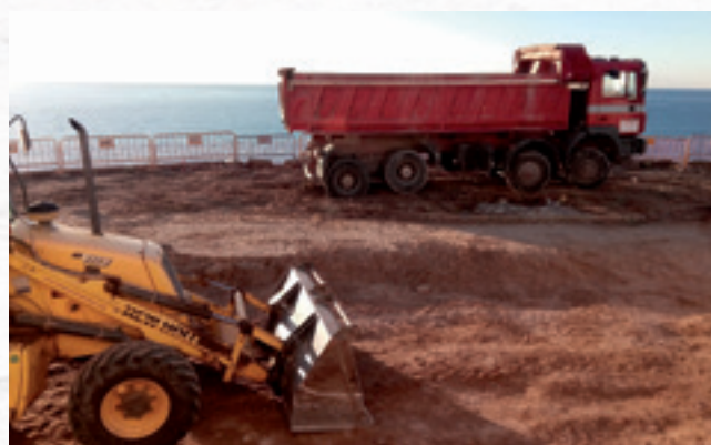
▲ Plaça Salvador Espriu