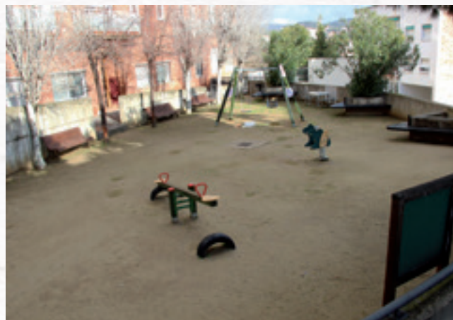
▲ Plaça Bellavista