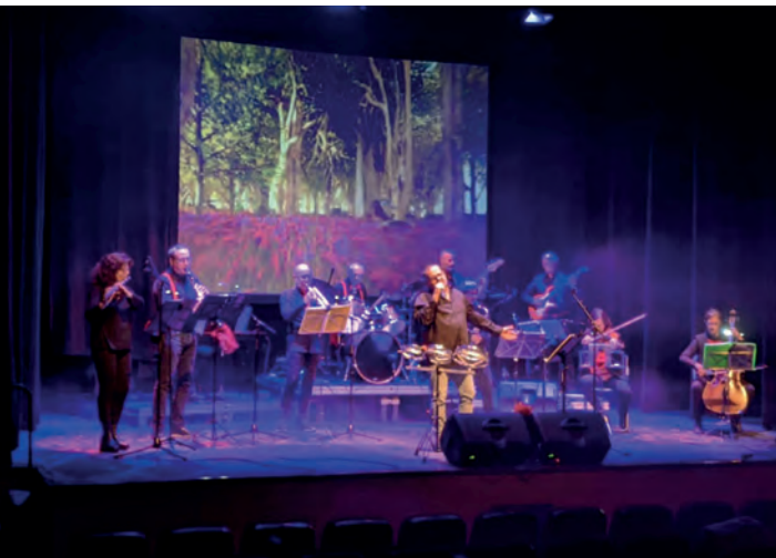
▲ Los Sarita.