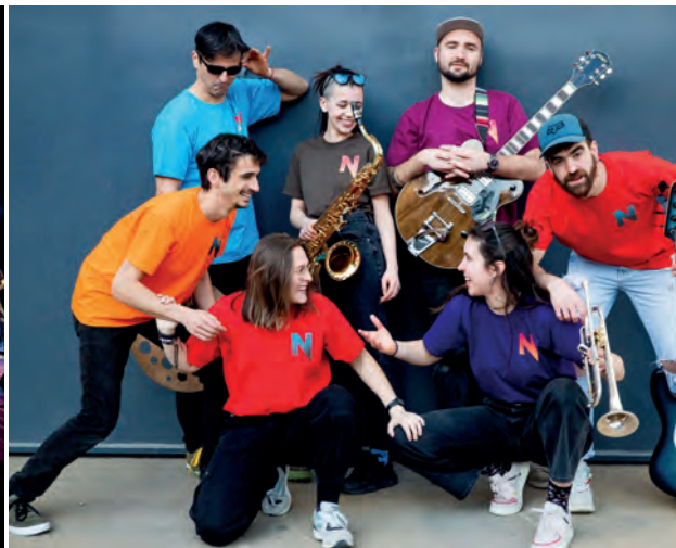
▲ Orquestra Mitjanit.

📌 Organitza: Cau Flos i Calcat, Associació Pubillatge, Patronat de Sant Roc i amb el suport de la Regidoria de Joventut