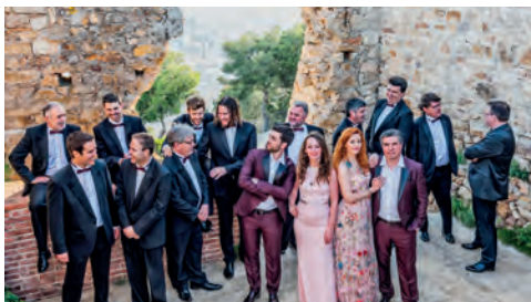
▲ Principal Ball.