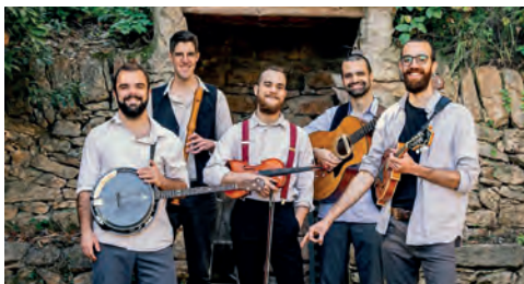
▲ Pony Pisador.