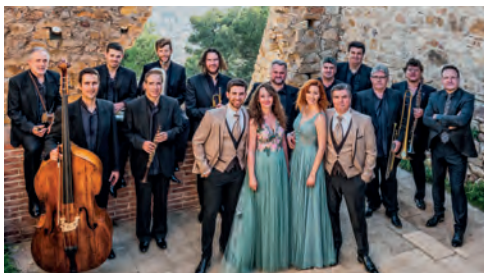
▲ Orquestra La Principal de la Bisbal.

📌 Organitza: Secció d'Escacs de l'Ateneu