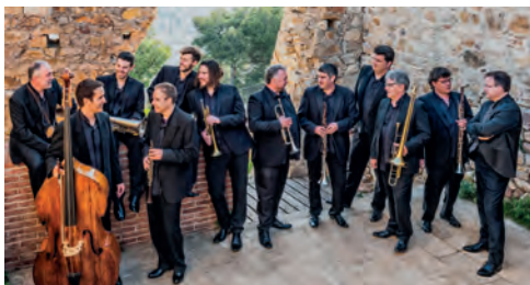
▲ Cobla La Principal de la Bisbal.