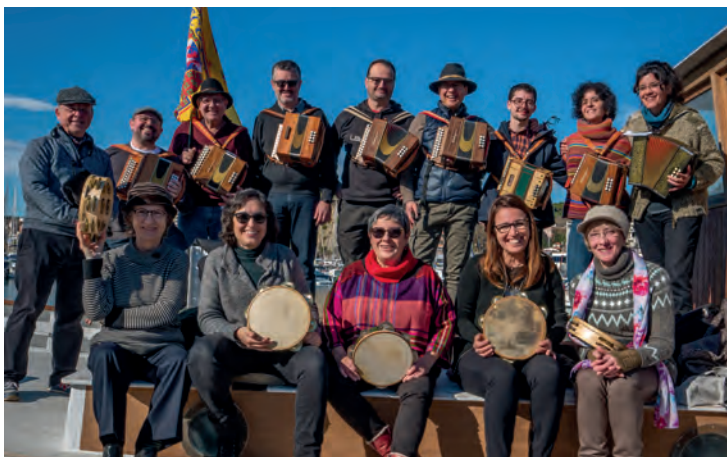
▲ Sant Zenon.