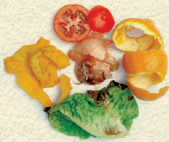
RESTES DE FRUITA I VERDURA