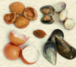
CLOQUES D'OU, DE FRUITA SECA I DE MARISC