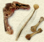
RESTES DE CARN I PEIX