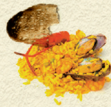
MENJAR CUINAT I PA SEC