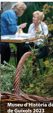
Museu d'Història de Sant Feliu de Guíxols 2023