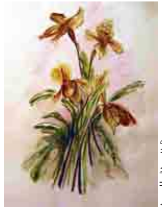
Aquarel·la d'Anna M. Doy