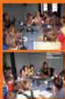
No us el perdeu!!!

Els dimarts i els dimecres de 19 a 19:30h podreu escoltar el programa que per als nens i nenes del Casal Digital a RÀDIO ARENYS DE MAR us ofereix un reportatge i podreu trobar seccions variades com el TOP TEN del Casal Digital, on podreu escoltar els temes que ens agraden als nens i nenes del Casal, recomanacions de llibres de tota mena i pel·lícules d'època, noves tecnologies, la notícia de la setmana, el reportatge i l'entrevista en què sabem què pensa la gent d'arenys sobre un tema i una tertúlia amb temes que ens interessin a tots.