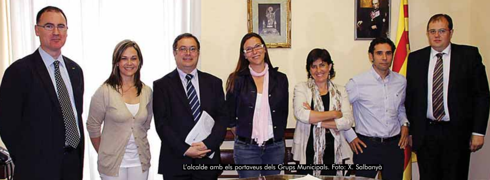
L'alcalde amb els portaveus dels Grups Municipals.