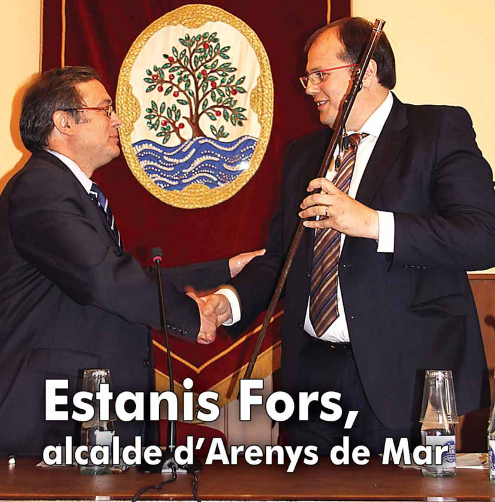
Estanis Fors, alcalde d'Arenys de Mar