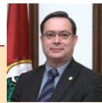
Fi de mandat (I)

L'ajust en el pressupost municipal fa que tots els departaments, del més gran al més petit, fem mans i mànigues per poder seguir oferint qualitat i servei i que, d'aquesta manera, les regidories d'Acció Social i Promoció Local puguin seguir tenint els recursos que necessiten en aquest moment.