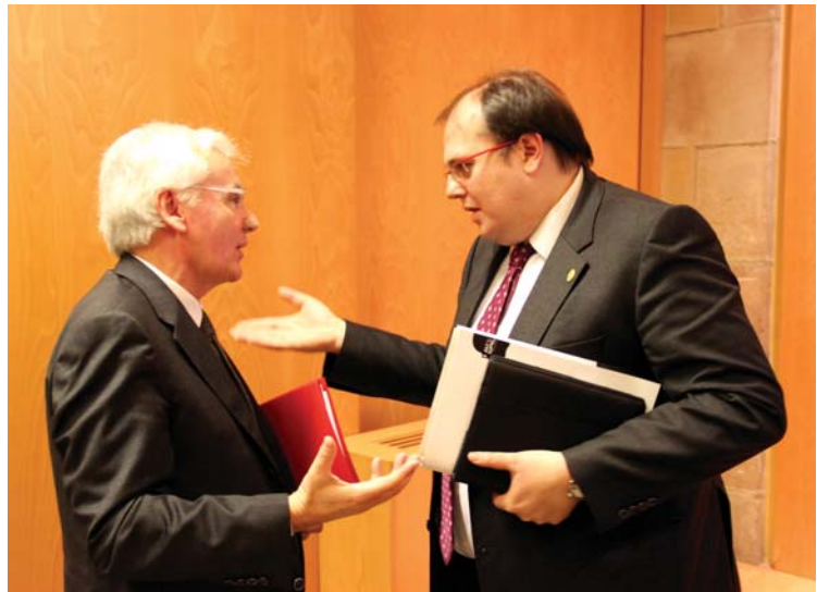
L'alcalde amb el conseller de Cultura, Ferran Mascarell, el dia de la presentació del programa d'activitats de l'Any Espriu

Arenys de Mar té un paper clau en l'imaginari de Salvador Espriu, més enllà del mot Sinera, conegut arreu del país. La nostra és la vila que va veure créixer aquest prolífic escriptor, compromès des de l'inici amb el seu país, amb la seva gent i, molt especialment, amb la seva llengua. Al nostre cementiri, encarat a la immensitat del Mediterrani, hi ha la seva tomba, un nínxol amb una austera làpida de marbre blanca que, sense menystenir la voluntat de qui hi és enterrat, no fa justícia a la grandesa de la seva obra i pensament.