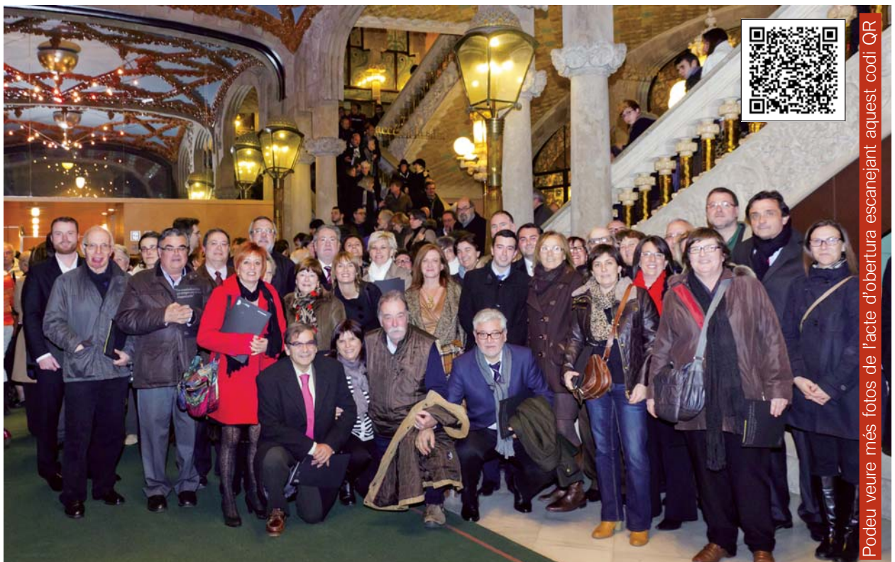
Podem veure més fotos de l'acte d'obertura escanejant aquest codi QR