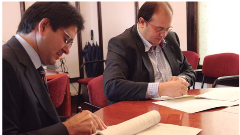
Moment de la signatura de l'inici de les obres al camp de futbol

Aquest mes de novembre han començat les obres del camp de futbol Bernat Coll, una intervenció que canviarà la fisonomia d'aquesta instal·lació municipal i que suposarà un gran pas endavant en la qualitat del servei. Es tracta d'una obra de gran envergadura, de més d'un milió d'euros, que ha comportat un gran esforç. I no només a nivell tècnic, sinó també a nivell logístic, ja que ha obligat a trobar nous emplaçaments on els equips de futbol puguin entrenar i jugar els seus partits. Des d'aquí vull agrair la paciència i la bona predisposició dels usuaris del camp de futbol que durant els pròxims mesos s'hauran de desplaçar als camps de Canet i Arenys de Munt i recordar que aquesta obra ens posicionarà a la comarca per disposar d'unes instal·lacions de primer nivell.